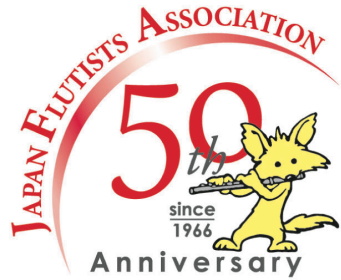
A ポジティブ表示・4色使用