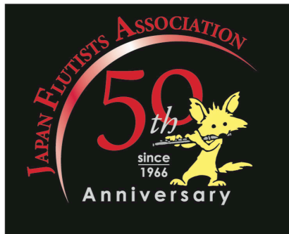
B ネガティブ表示・4色使用